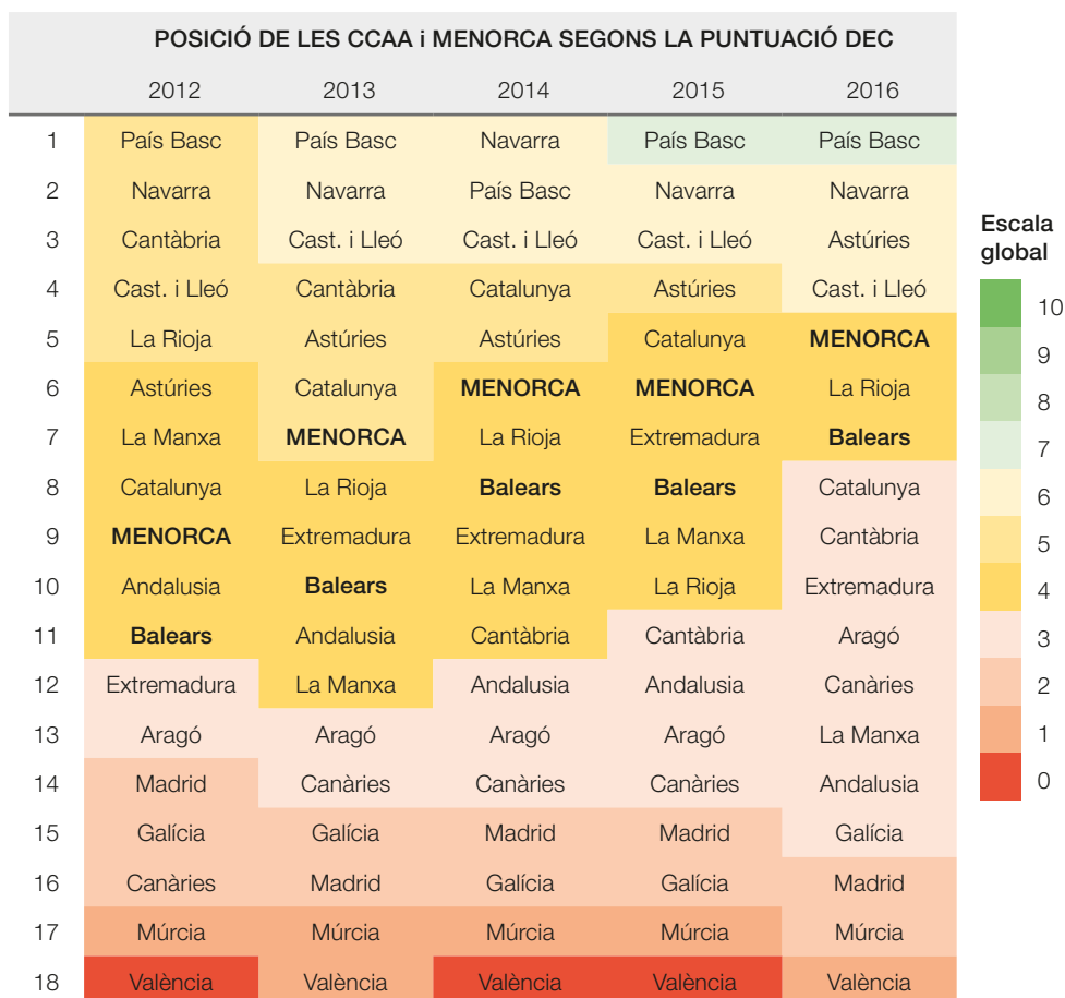
Taula 2. Posició de les comunitats autònomes i Menorca segons la puntuació global obtinguda en l'índex DEC. 2012-2016. Elaboració pròpia.

Des d'una perspectiva temporal, Menorca ha obtingut en aquests cinc anys una puntuació global per damunt dels quatre punts DEC, amb l'excepció del 2013, en el qual en va obtenir cinc. En l'àmbit de posició en el marc de les comunitats autònomes, ha millorat una o dues posicions cada any —amb l'excepció de 2015—, amb la qual cosa ha passat de la novena posició el 2012 a la cinquena el 2016. Aquest augment és com a conseqüència, en part, de la millora de la puntuació, però també d'una disminució de la puntuació d'una bona part de les comunitats autònomes —els que obtenen menys de quatre punts passen de ser set el 2012 a onze el 2016. En el conjunt de les Illes Balears es produeix la mateixa evolució, però sempre unes dues posicions per davall de Menorca.